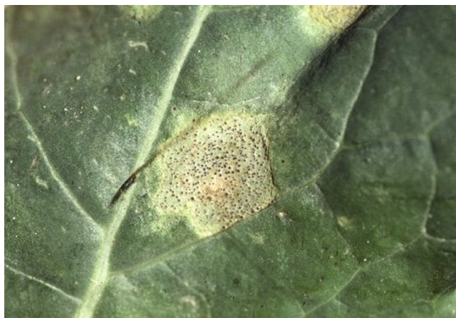
Billede 3. Nærbillede, hvor de sorte frugtlegemer ses.