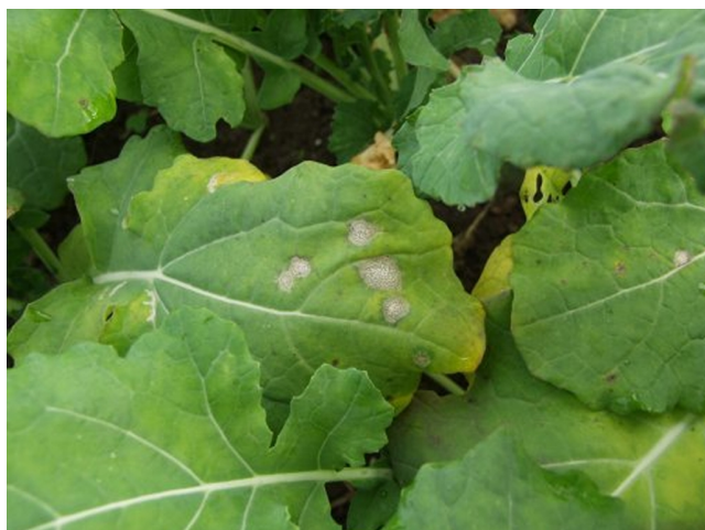
Billede 2. Angreb af rodhalsråd på bladene er let at kende og kan ikke forveksles med andre svampesygdomme. Bladpletterne er hvide, og de talrige små sorte frugtlegemer ses tydeligt.