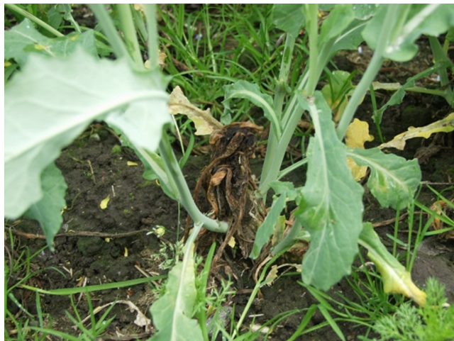
Billede 1. Vinterraps i foråret med frostskaadet hjertesku. Planten har overlevet vinteren og skyder i foråret fra siden.

I 12 forsøg i 2008-2010 har både Folicur, Juventus og Cantus indgået i forsøgene, og midlerne har resulteret i bruttomerudbytter på samme niveau.